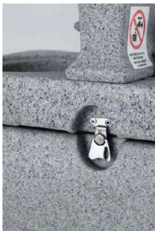
Cierre con llave para seguridad