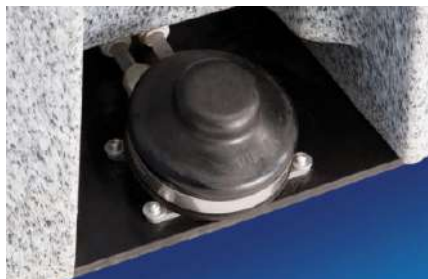
La bomba de pie se encuentra ubicada convenientemente en un hueco eliminando la exposición al tráfico