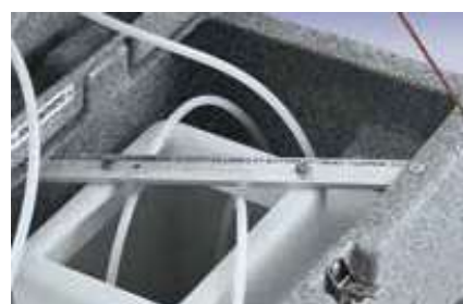
Dispensador de papel grande que usa una toalla de papel de 3 hojas