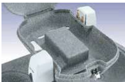
Fácil acceso para llenado