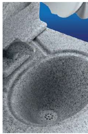
Los agujeros de drenaje integrados evitan que los desechos entren al cuerpo del lavamanos.